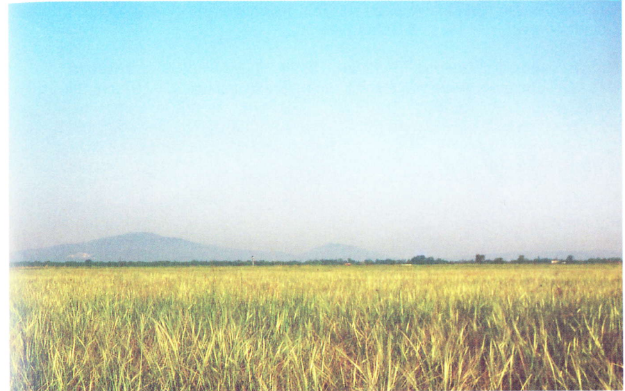
Abb. 1: Federgrasflur im zentralen Steinfeld / Niederösterreich. Diese in Mitteleuropa einmalige Steppenlandschaft beherbergt bedeutende Vorkommen u. a. von Gampsocleis glabra , Platycleis monatana , Platycleis veysseli , Celes variabilis , Stenobothrus nigromaculatus und Omocestus petraeus .

Nach MALICKY (1969) stellt das Steinfeld das größte natürliche Steppengebiet Mitteleuropas dar. Trotz großer Flächenverluste in den vergangenen Jahrzehnten bedecken Federgrasheiden (Abb. 1), als wichtigster Lebensraum von Gampsocleis glabra , hier immer noch mehr als 20 km 2 , die zum weit überwiegenden Teil innerhalb militärischer Sperrgebiete liegen. Aufgrund der positiven Einstellung der zuständigen Dienststellen des Österreichischen Bundesheeres kann davon ausgegangen werden, daß der Fortbestand eines der größten mitteleuropäischen Vorkommen der Heideschrecke am Truppenübungsplatz Großmittel gesichert ist. Im Gegensatz dazu droht der Population auf dem Wiener Neustädter Flugfeld infolge Verbauung ein völliger Lebensraumverlust. Gegenüber Naturschutzargumenten zeigten sich die politisch Verantwortlichen in Wiener Neustadt bislang wenig aufgeschlossen.