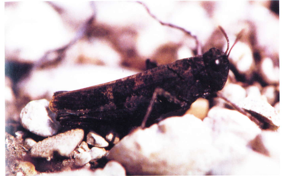
Abb. 2: Männchen von Celes variabilis ; Großmittel / Niederösterreich (1997).

Das Areal dieser typischen Steppenart erstreckt sich von Mitteleuropa bis nach Sibirien, Kasachstan und Mittelasien. In Kleinasien, den Kaukasusländern und Ostasien sind mehrere Unterarten entstanden (Kaltenbach 1970). In Mitteleuropa gilt Celes variabilis in Slowenien und Polen als wahrscheinlich ausgestorben (LIANA 1992, MATVEJEV 1992). Ein ehemaliges (?) Vorkommen in Deutschland wird widersprüchlich behandelt (DETZEL 1995, INGRISCH & KÖHLER 1998a, b). Aktuelle Vorkommen dürften in Mähren, der Slowakei (MARAN & CEJCHAN 1977) sowie in Ungarn (RÁCZ 1986) bestehen.