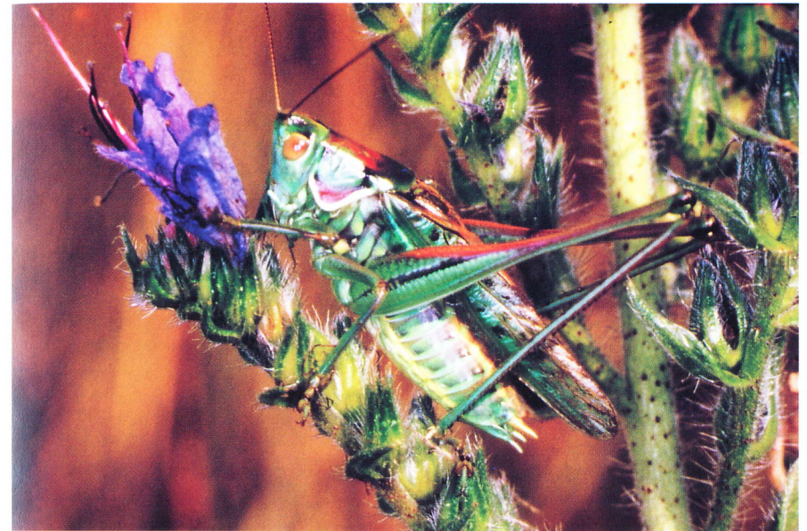
Abb. 3: Männchen von Gampsocleis glabra , Steinfeld / Niederösterreich (1996).

Völlig überraschend war daher der Fund eines Männchens dieser Art am 18. Juli 1998 im niederösterreichischen Steinfeld am Rand des Truppenübungsplatzes Großmittel in einem weitläufigen Steppenrasengelände (Abb. 4). Die Fundumstände sind allerdings kurios und machen eine Bewertung des Nachweises vorerst schwierig. Wir fanden das Exemplar, neben den im Gebiet häufigen Arten Platycleis montana und Metrioptera bicolor gegen 22.00 Uhr MESZ auf einem Leuchtschirm, der zum Fang von Noctuiden betrieben wurde. Die Möglichkeit einer Verschleppung drängt sich auf, zumal die Betreiber des Leuchtschirms zuvor in ungarischen Vorkommensgebieten von Myrmeleotettix antennatus Lepidopteren-Aufsammlungen durchgeführt haben. Der zeitliche Abstand dieser Exkursion (13. Juli), das sorgfältige Absammeln der Leuchtschirme, ihre Unterbringung in Metallkästen sowie das heiße Wetter schließen eine Lebendverschleppung des Exemplares sowie nach Einschätzung der Sammler (H. & H. FORSTER mündl. Mitt.) weitgehend aus. Ein Transport mittels PKW über einen Zeitraum von fünf Tagen erscheint gleichfalls wenig wahrscheinlich. Dessen ungeachtet fehlt bisher jeglicher Hinweis auf ein autochthones Vorkommen; die bisherigen Nachsuchen vor Ort blieben erfolglos.